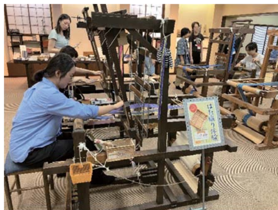
今年度の企業見学ツアーの様子