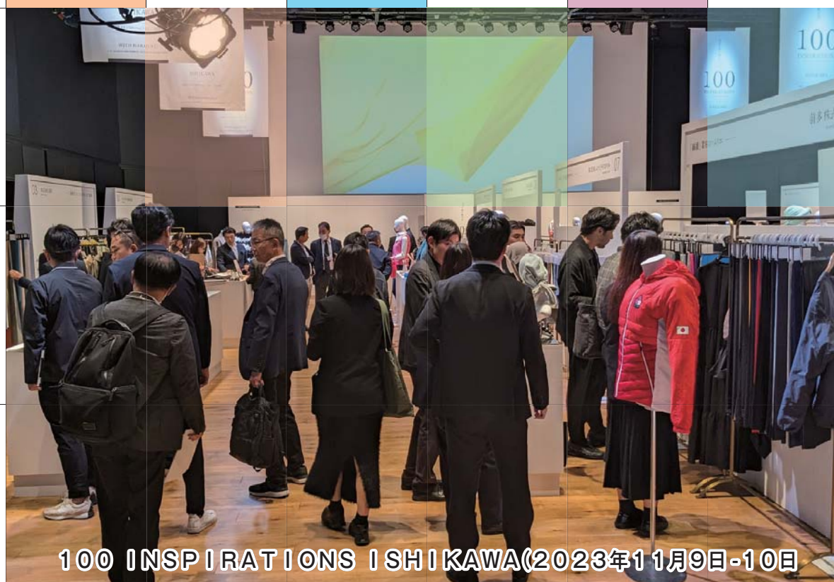
100 INSPIRATIONS ISHIKAWA(2023年11月9日-10日)