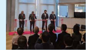
オープニングセレモニーの様子