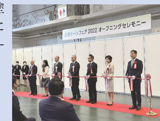
オープニングセレモニーの様子