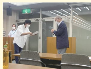
修了証書授与の様子