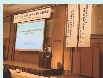
田上氏講演の様子