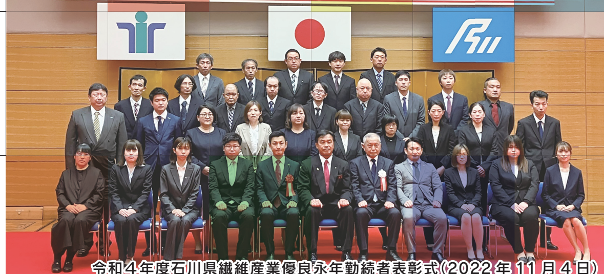
令和4年度石川県繊維産業優良永年勤続者表彰式(2022年11月4日)