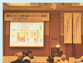
富吉氏講演の様子