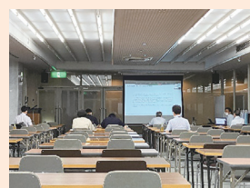
モノ創り支援講座の様子① モノ創り支援講座の様子②