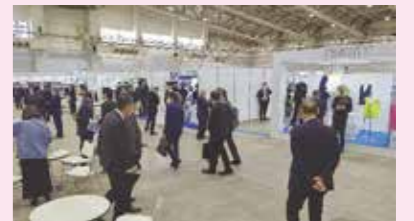
(昨年の会場の様子)