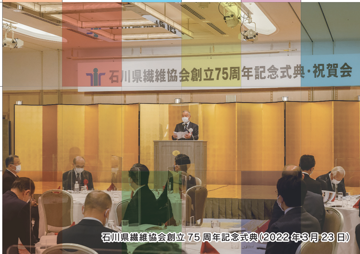
石川県繊維協会創立75周年記念式典(2022年3月23日)