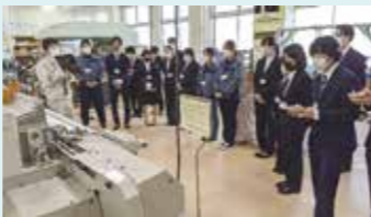
(若手社員セミナーの様子)