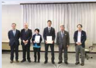
【第3回 織物分解設計マイスター認定者】(順不同)