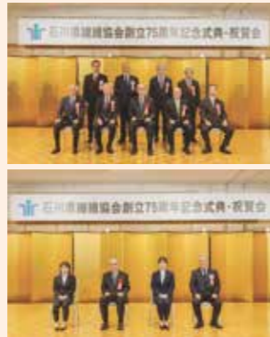
【繊維協会役員功労者表彰】(順不同)